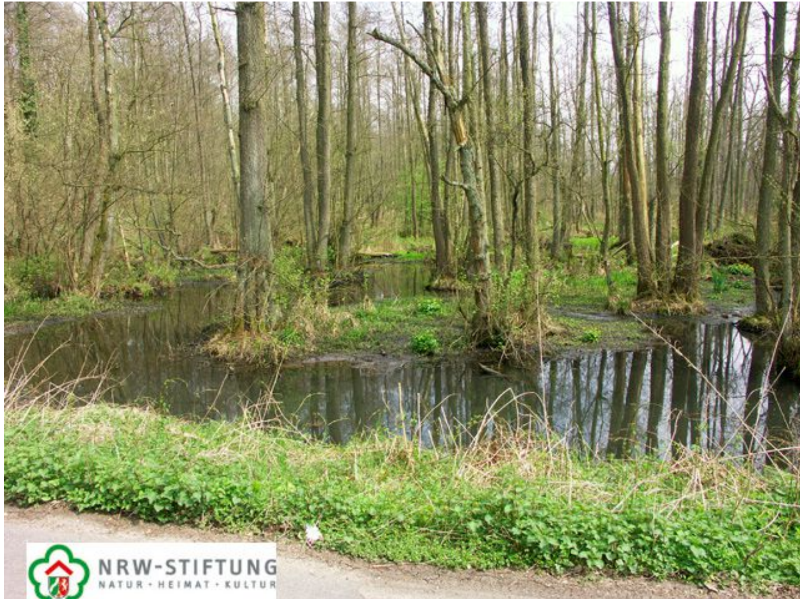
Das Helpensteiner Bachtal mit seinem sumpfigen Erlenbruchwald gehört zu einem Projekt der NRW-Stiftung.