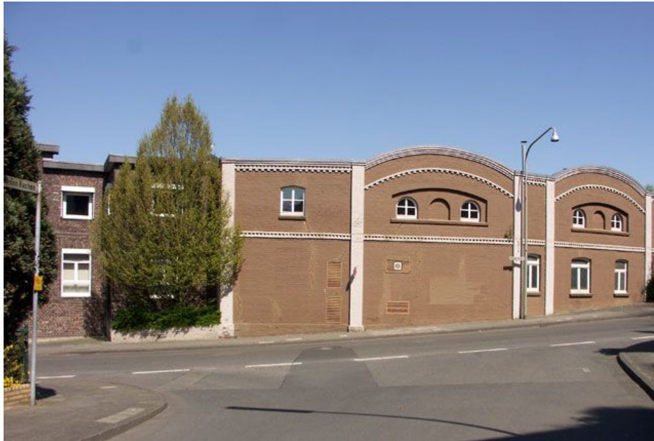
Punkt 8 , Einmündung Roedgener Strase. Links weiter.