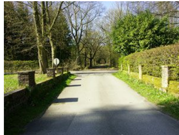
Nur wenige Meter und wir sind bei Punkt 10 angelangt. Rechts weiter.