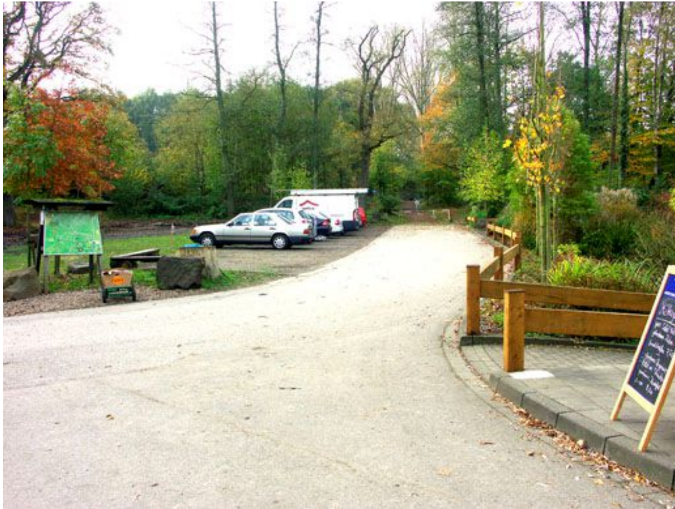
Dalheimer Mühle, Punkt 1

Der Wanderweg führt in Blickrichtung entlang der Schranke und folgt dem Wanderzeichen A3.