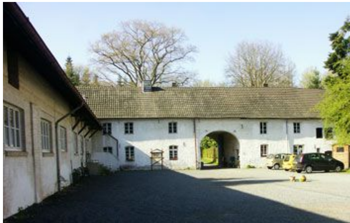
...überqueren den Klosterhof und verlassen ihn durch das Hoftor gegenüber.