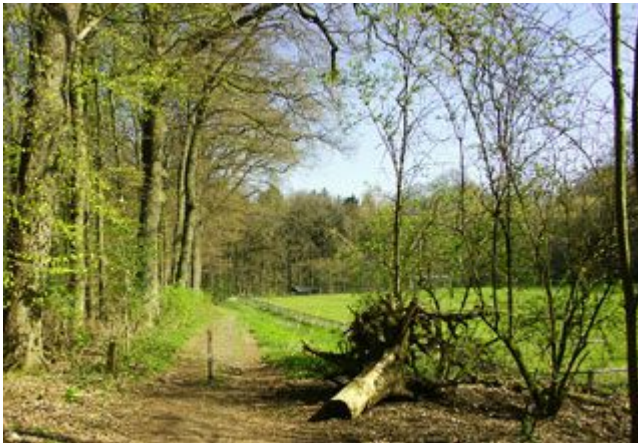
Der Weg führt entlang des alten Dalheimer Waldsportplatzes.