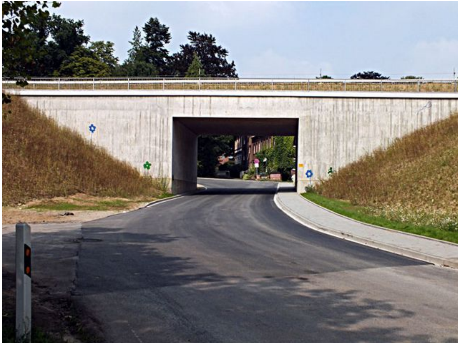
Punkt 9 , Eisenbahnunterführung. Wanderer mit der Bahn können hier den Rundweg beginnen. Es geht links weiter entlang des Bahndamms durch das Helpensteiner Bachtal.