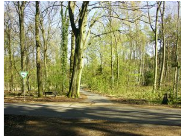
Punkt 7 Wegkreuzung Mühlenstr./ Unter den Buchen. Geradeaus weiter bis zur Einmündung in die Rödgener Straße.