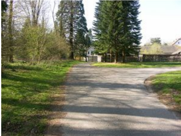
In Sichtweite des Dalheimer Klosterhofes