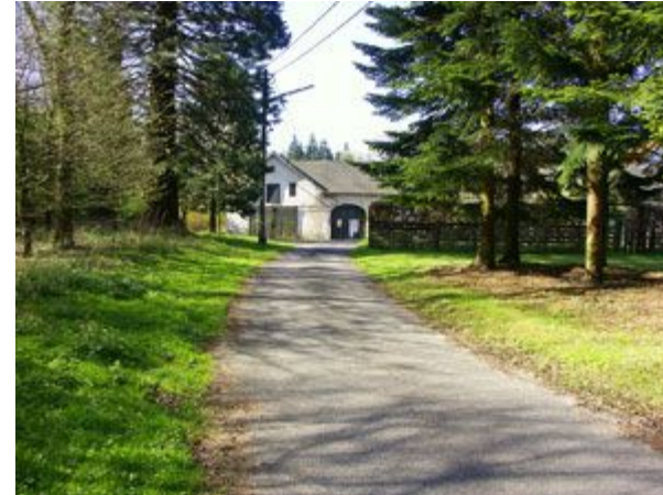
gehen wir weiter geradeaus durch das Hoftor,